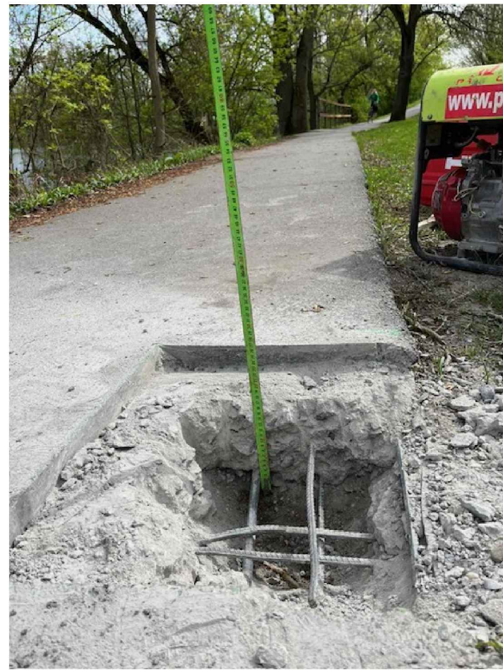
asfaltobeton - tl.50 mm železobeton - 2 x armovaný R12 - tl.15 mm původní zemina