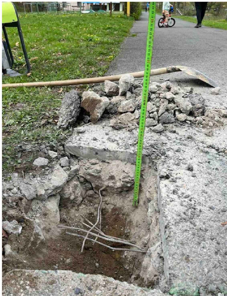
asfaltobeton - tl.50 mm železobeton - 2 x karsit 150/ 150 - tl.17 mm původní zemina